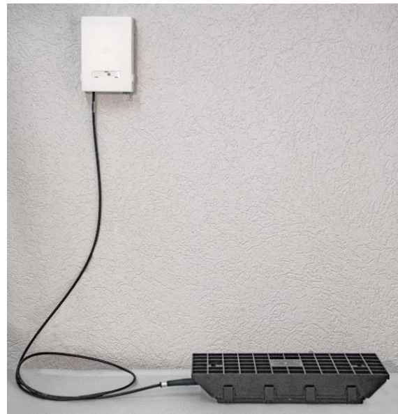
Die neue RESA-Lösung von HUBER+SUHNER besteht aus dem RESA BEP (oben) und der RESA SC (unten) mit dem Q-ODC-2 Mini-Verbinder.

Die modulare Konnektivitätslösung umfasst die erdverlegte RESA Spleissbox (RESA SC), das vorkonfektionierte Building Entry Point (RESA BEP) Modul und Q-ODC-2 Minikabel. Die Module können rauen Aussenbedingungen (IP68) in einer Vielzahl von Klimazonen standhalten und bieten den Kunden eine langfristige FTTH-Netzwerkonnektivität.